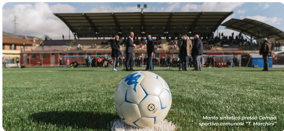
Manto sintetico presso Campo sportivo comunale “T. Marchini”

Su quel campo ad oggi si allenano oltre 200 ragazzi e ragazze iscritti alle società sportive del nostro comune;