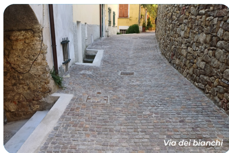
Via dei bianchi