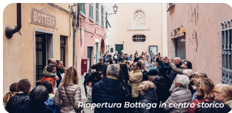
Riapertura Bottega in centro storico