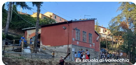
Ex scuola di Vallecchia

In questi primi mesi del 2024, l'Amministrazione Comunale ha promosso e sostenuto la nascita di una ulteriore cooperativa di Comunità nell'ambito del Capoluogo, utile alla riapertura dell'unica bottega alimentare.