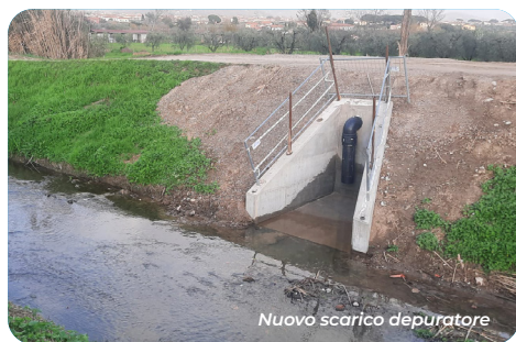
Nuovo scarico depuratore